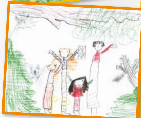
Charlotte B., 5 Jahre

Die drei schönsten Werke gewinnen jeweils 4 Tage im Casa Familia und hängen als kleine Ausstellung das ganze Jahr an der Kinderclub-Wand am Eingang. Wir freuen uns auf die nächsten Meisterwerke!