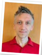
Service Thomas Köhler