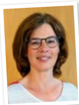
Verwaltung Chris Pape